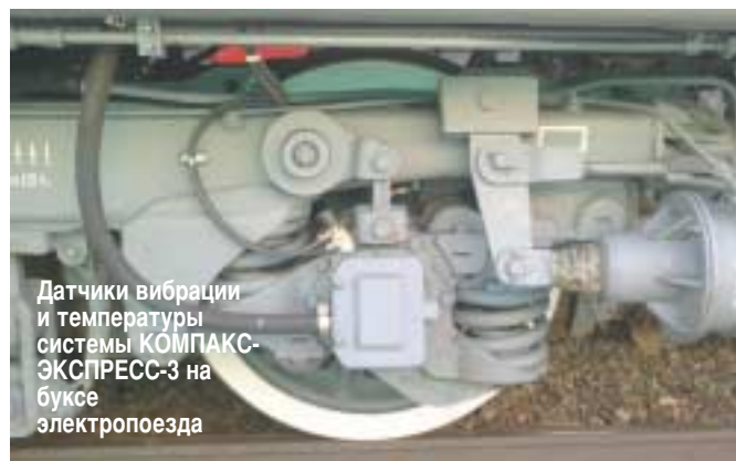
Датчики вибрации и температуры системы КОМПАКС-ЭКСПРЕСС-3 на буксе электропоезда

В настоящее время компонентами АСУ БЭР™ оснащены депо Москва-2, Раменское и Санкт-Петербург-Московское (Финляндская площадка), на базе которых организуется полигон по отработке прогрессивной технологии обслуживания и ремонта моторвагонного подвижного состава на основе объективной информации о фактическом техническом состоянии.