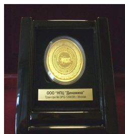
Медаль "Добросовестный поставщик года" 2008 год.